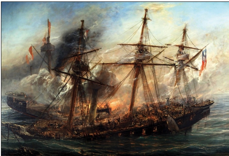
Combate Naval Iquique – Thomas Somerscales

Así, cuando el monitor Huáscar descargó la violencia de su espolón sobre la