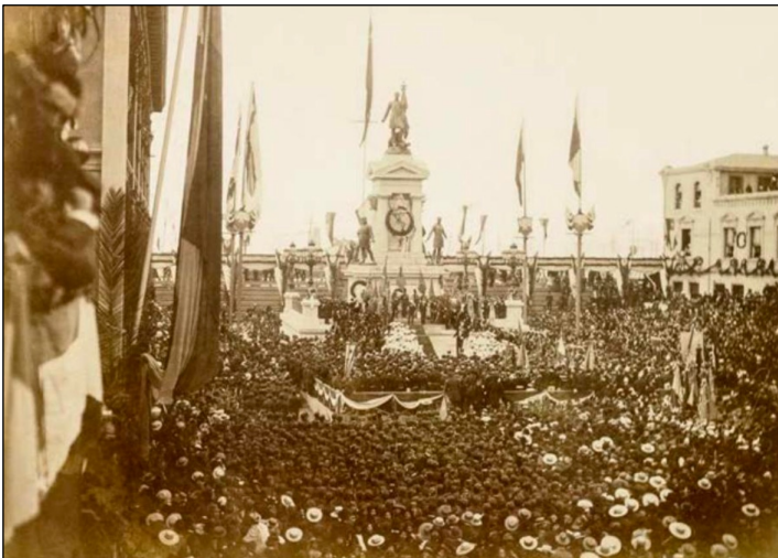
Multitudinaria ceremonia en el monumento a los Héroes de Iquique, Valparaíso